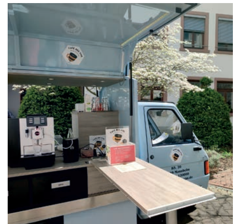
Unsere APE, das mobile Café