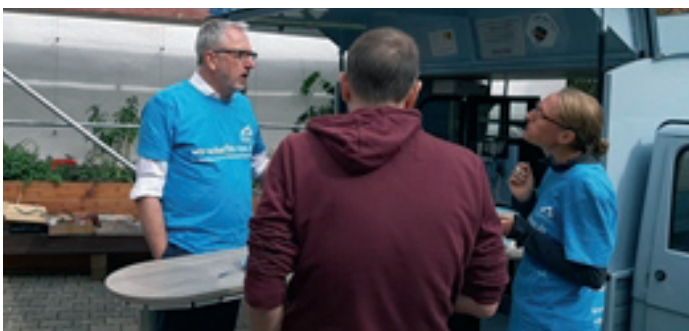
Kurze Kaffeepause an der APE mit unserem neuen Vereins-Mitglied