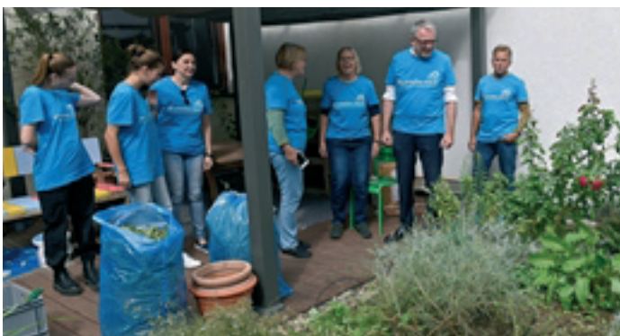
Die Dachterrasse wird verschönert-auch der Oberbürgermeister ist beeindruckt!