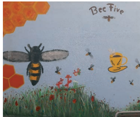
Das neue Wandbild